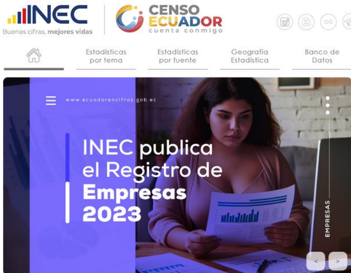
Imagen 2 Página WEB institucional REEM-2023

Página web destinada para el REEM, en este espacio se publica toda la información referida a los productos mínimos: